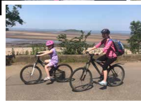
V okolí města je spousta možností, kam vyrazit na výlet na kole.