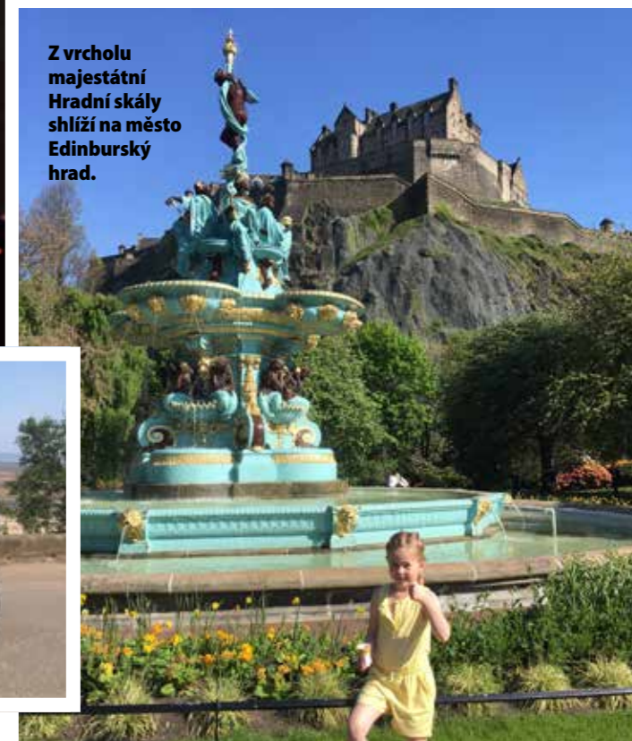
Z vrcholu majestátní Hradní skály shlíží na město Edinburský hrad.