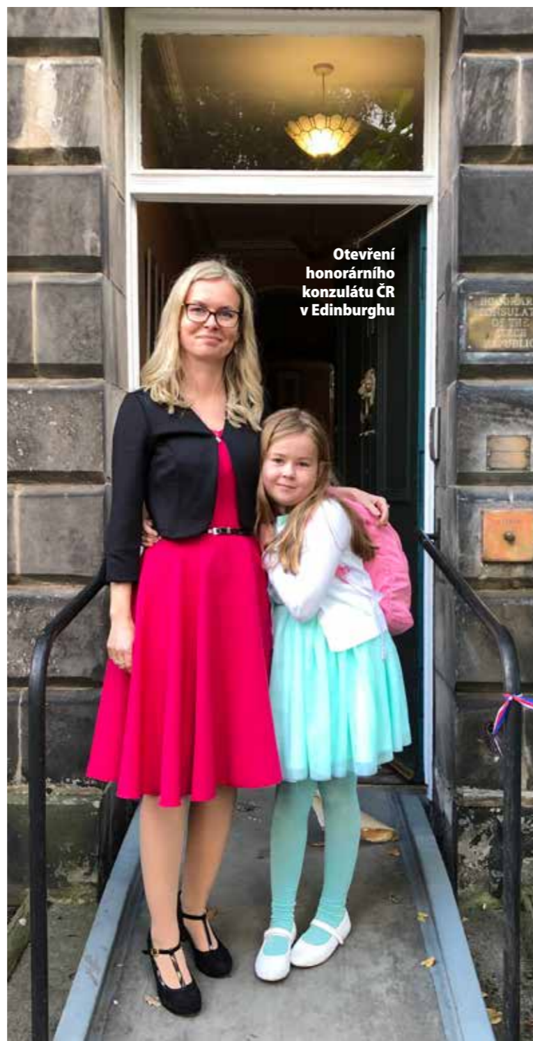
Otevření honorárního konzulátu ČR v Edinburghu